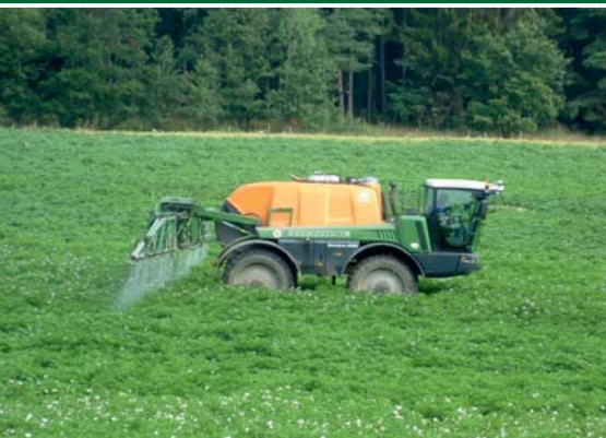
Obr. 1 – Obsluha postřikovače musí být držitelem osvědčení min. I. stupně