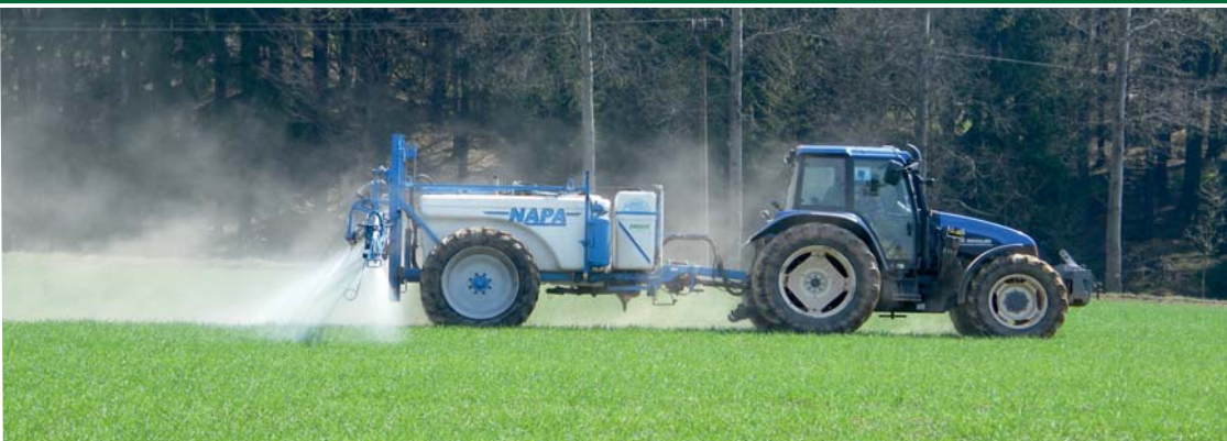
Obr. 6 – Jak tuto aplikaci vidí odborně způsobilá osoba?