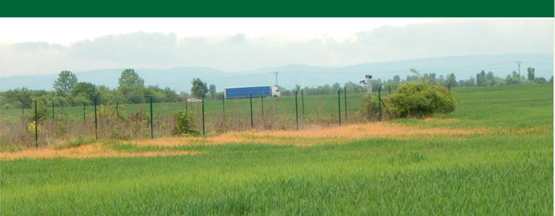
Obr. 3 – Příklad nesprávné aplikace přípravku na ochranu rostlin

41-42- M/01 Vinohradnictví, 41-44-M/01 Zahradnictví, 41-45-M/01 Mechanizace a služby nebo vysokoškolského magisterského studijního programu se zaměřením na fytotechniku.