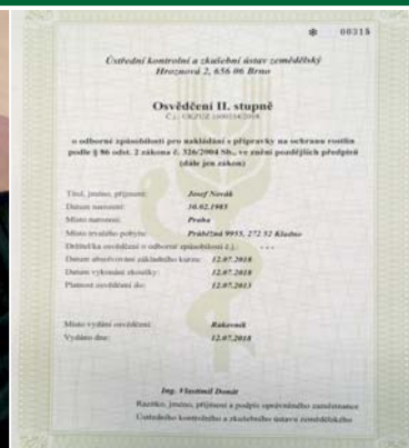
Obr. 5 – Vzor osvědčení II. stupně

III. stupeň – absolvování doplňujícího školení pro III. stupeň u vzdělávacího zařízení pověřeného MZe. Délka školení je 8 hodin. Po absolvování školení je potřeba úspěšně absolvovat u ÚKZÚZ zkoušku. Zkouška je písemná a lze ji absolvovat buď na konci doplňujícího školení nebo na předem vyhlášených termínech u ÚKZÚZ. K prodloužení osvědčení musí dojít před uplynutím doby platnosti původního osvědčení, ale nejvýše 1 rok před koncem platnosti dosavadního osvědčení. Délka platnosti osvědčení je 5 let.