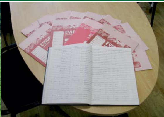
Obr. 2 – Dohled nad vedením záznamů o používaných přípravcích provádí držitel osvědčení II. stupně (resp. III. stupně)

I. stupeň – absolvování základního kurzu u vzdělávacího zařízení pověřeného MZe. Délka kurzu je 12 hodin a osvědčení I. stupně je vydáno vzdělávacím zařízením na konci kurzu bez nutnosti absolvování zkoušky. Délka platnosti osvědčení jsou 3 roky.